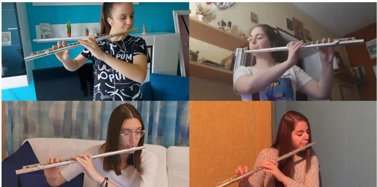
Слика бр.3: Први пристигли снимци.

Технички, овакав пројекат представљао је велики изазов, а исход је до самог краја био неизванстан, те је сарадња са предметним наставницима, наставницима солфеђа, као и са родитељима, представљала кључан елемент. У року од неколико дана ученици су добили ноте, матрице и прва упутства како да приступе раду на својим деоницама. Помало неочекивано, наишао сам на врло срдачну сарадњу родитеља, који су од самог почетка били врло ангажовани у овом пројекту. Врло брзо, почели су да стижу први снимци.