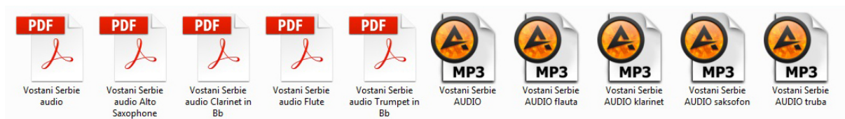
Слика бр.2: Слика матрица и нота које су ученицима послате путем мејла.

Сваком ђаку је објашњен начин снимања уз матрице, који није био нимало једноставан, зато што су у питању ђаци основне школе, који се са оваквим начином рада углавном срећу по први пут.