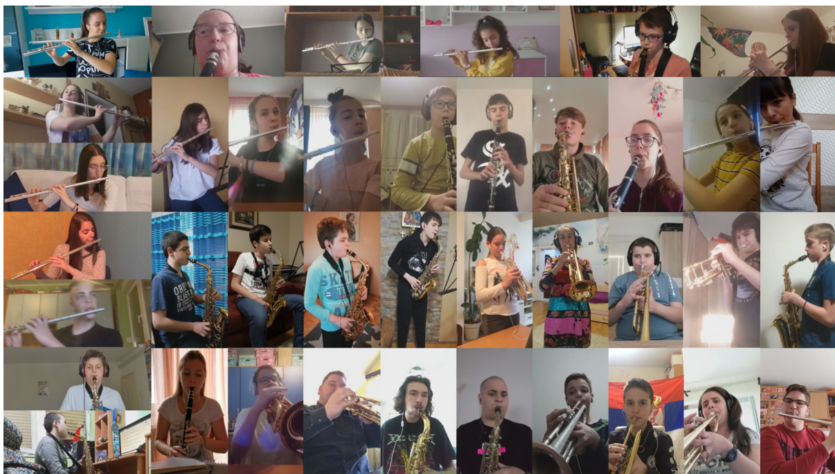
Слика бр.6: Слика финалног одсека композиције.

На самом крају, а због велике неизвесности од почетка, финални видео запис је био изненађење за сваког наставника који је био укључен у процес. Тек када смо по први пут прегледали видео без прекида, видело се колико су ученици били укључени, са којом су пажњом и са каквим ентузијазмом пришли овом послу. Коментари родитеља су, без изузетка, били позитивни, као и коментари колега из Школе. Видео, после месец дана, на интернету има преко 2000 прегледа и велики број дељења по друштвеним мрежама.