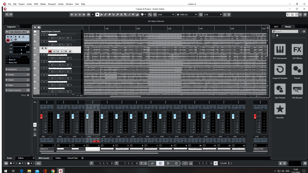
Слика бр.4: Исечак из аудио софтвера у којем је миксован звук.

По завршетку прикупљања снимака, приступило се раду на аудио миксу композиције у софтверу за аудио продукцију. Процес рада је трајао неколико дана, а највећи изазов је представљао различит квалитет снимака, условљен квалитетом мобилних телефона којима су се ђаци снимали. Из жеље да сви ученици буду укључени у финални снимак, неколико ђака је морало поново да snими своје деонице, уз појашњење како да технички што боље приступе томе.